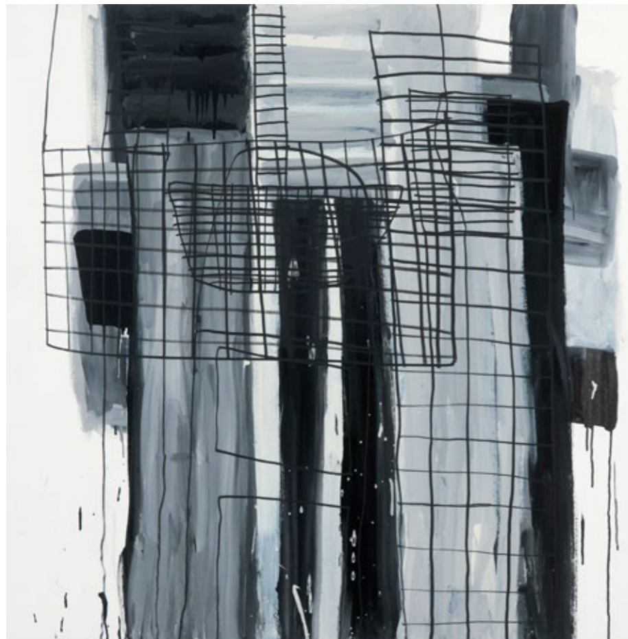
Peinture à l'huile et feutre sur toile