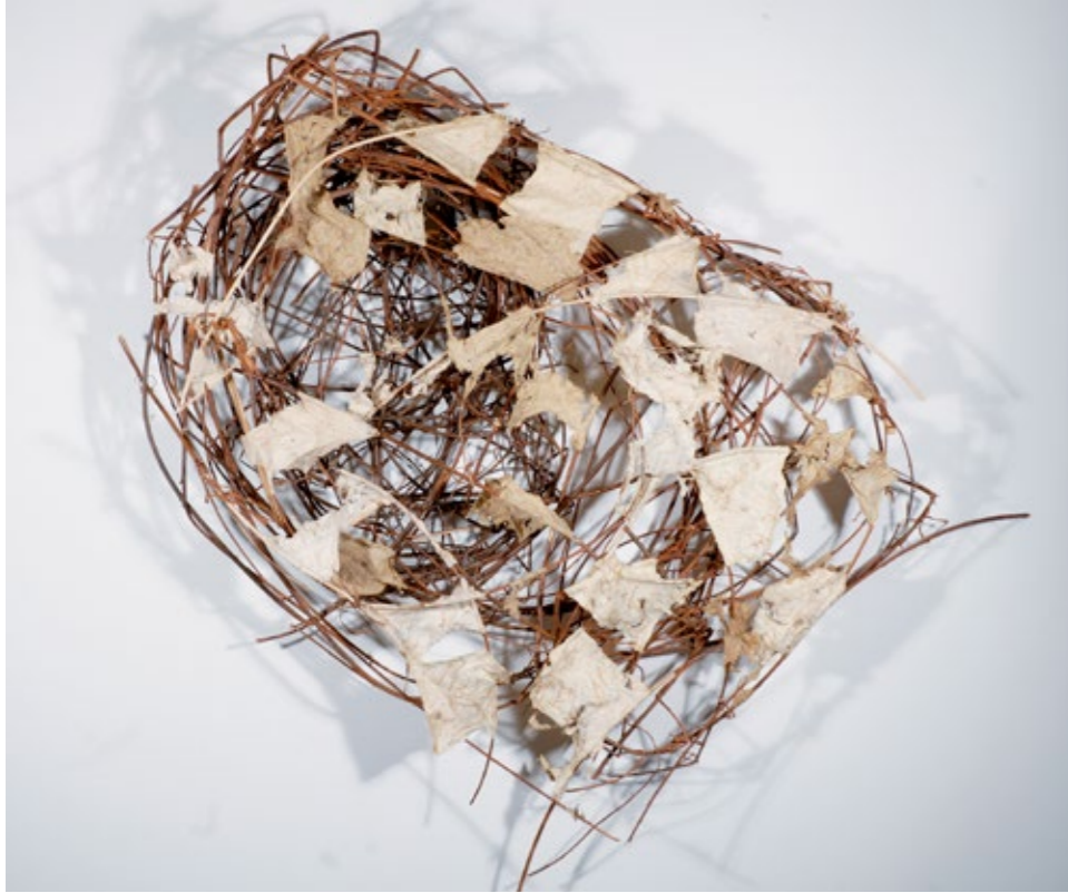
Bois et papier végétal