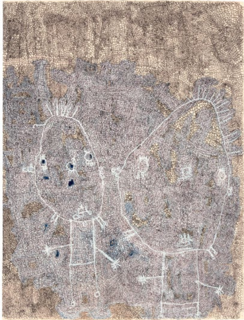
Bic sur papier