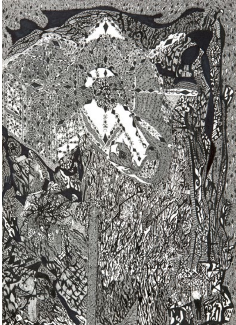
Feutre sur papier