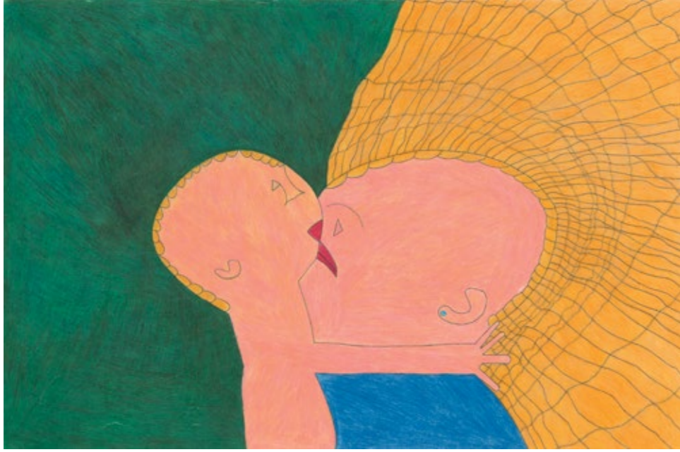
Crayon de couleur sur papier