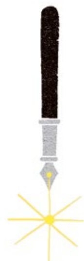
Illustration : François Godin